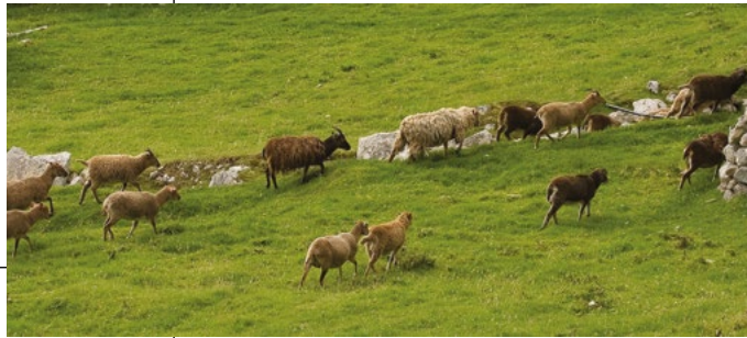
La pecora di Soay

Nel 2005, Saint Kilda fu inserita nella Lista del Patrimonio Mondiale ottenendo il duplice status di luogo d'importanza naturalistica e culturale.