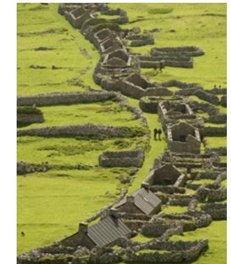
Da sinistra a destra Dun vista da Ruaival Cleitean e ovili con muri a secco sopra al villaggio Village Bay La Strada