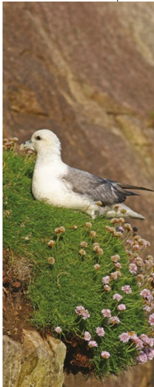
Fulmaro e Parsimonia (Armeria maritima)