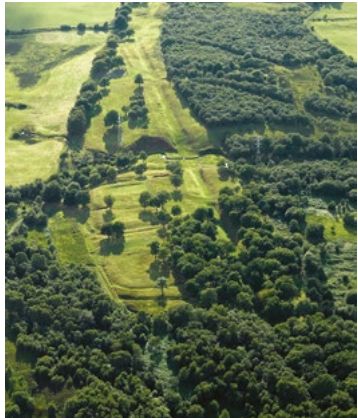
Rough Castle