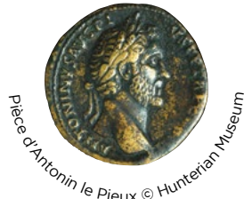
Pièce d'Antonin le Pieux © Hunterian Museum

Il y a près de 2000 ans, le Mur d'Antonin était la frontière du nord-ouest de l'Empire romain. Construit sur les ordres de l'Empereur Antonin le Pieux après l'an 140, il s'étendait sur 40 miles romains (60 km) du Bo'ness actuel sur le Firth de Forth à Old Kilpatrick sur la Clyde.