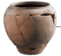
Pot de Mumrills, Falkirk

Certains des segments du rempart, du fossé et de la Voie Militaire les mieux préservés se trouvent à Croy Hill et à Seabegs. De beaux forts sont visibles à Bar Hill et à Rough Castle, et des bains romains subsistent à Bearsden et à Bar Hill.