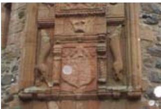
Suaicheantas Tighearna/ Bantighearna Hunnadaidh