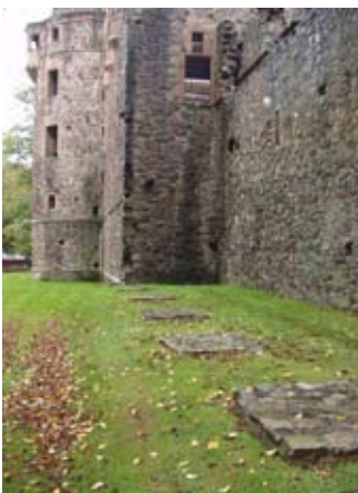
Fuighill bhoghanan air a' chadha