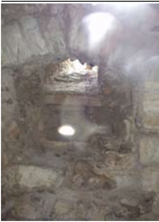
Uisge a-steach 's a-mach