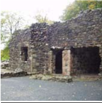
Taigh-grùdaidh is Taigh-Fuine