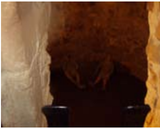
Sloc a' phrìosain

Bu tric na Gòrdanaich fhèin an trioblaid. Chuir seanair Sheòrais cath an aghaidh Màiri Banrigh nan Albannach. Nuair a bhuannaich ise, chuir i às dha mhac. Chaidh a chorp gu deuchainn is fhuaradh ciontach e 's mar sin thug Màiri an caisteal air falbh o na Gòrdanaich. Chaidh am mac eile, athair Sheòrais, a chumail mar phrìosanach. Nuair a phòs Màiri, thug i mathanas do na Gòrdanaich - thug, agus an caisteal.