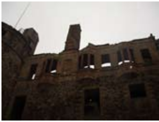
Am balla deas le ainmean snaighte