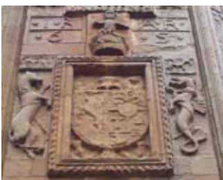
Suaicheantas Sheumais VI