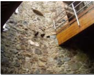
Sailean mullaich san talla mhòr