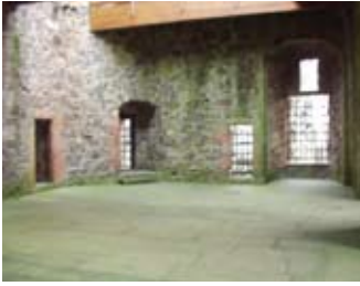
An Talla Mòr