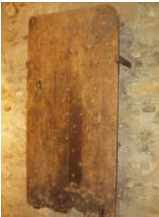
An doras tùsail

Ann an caisteal mar seo bhiodh mu 150 sgalag ag obair! Bha an stiùbhard os cionn a h-uile duine - còcairean, sgalagan 's mar sin. Bha am marasgal os cionn còmhdhail - eich, cairtean, bàtaichean. Bha an neach-glèidhidh , no am maor-sìth , os cionn tèarainteachd - geàrdan is buill-airm. Bha sagart/ ministear os cionn sgrìobhadh litrichean - mar rùnaire pearsanta - 's thug e comhairle spioradail do Thighearna Hunndaidh. Tha fhios gun robh e coltach ri baile beag trang an seo.