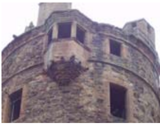
Tùr le pàtran obair-ròpa