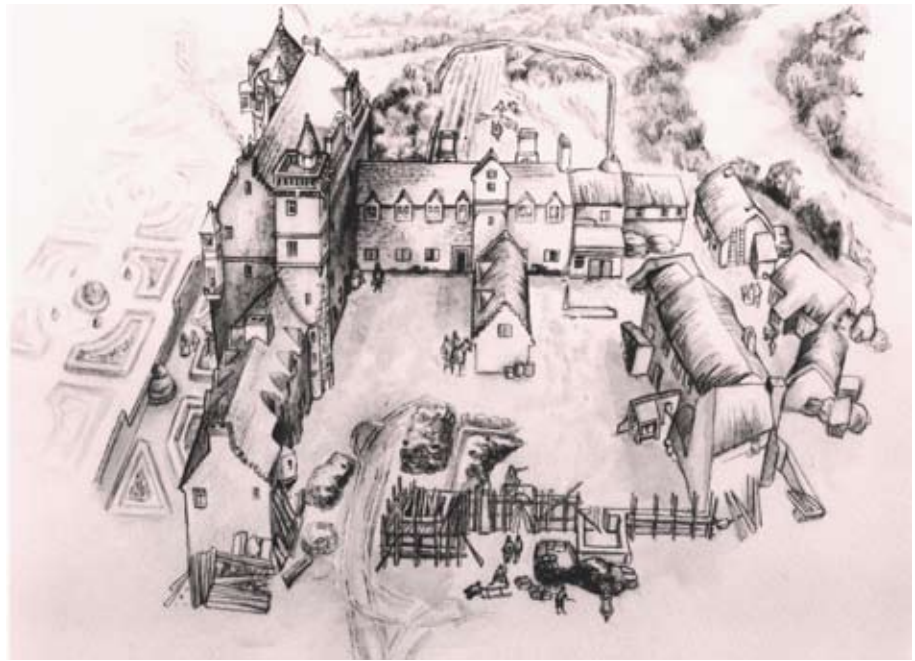
Dealbh peantar den chaisteal ann an 1643

Gabh tron gheata ri taobh bùth a' chaisteil. Cum dìreach air aghaidh gus am bi tu ri balla mòr deas a' chaisteil, far a bheil sgrìobhadh mòr snaighte air a' chloich aig a' bhàrr.