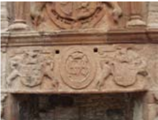
Teallach san talla a-muigh, a' sealltainn litrichean is tuill-coinnle

B' e seo fear de na caistealan a bu ghrinne an Alba. Aig aon àm bha naoi leapanan sàr-mhaisichte sa chaisteal! Thug e buaidh air màthair Màiri Banrigh nan Albannach, Màiri à Guise, 's i air chèilidh... ach an uairsin bha dragh oirre gun robh na Gòrdanaich a' fàs ro chumhachdach.