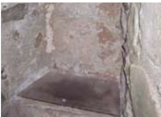
Clòsaid latrine ri taobh seòmar an Stiùbhaird