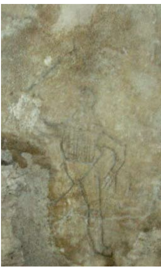
Cruth fir ann an sgrìobhadh sgròbach