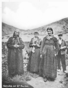
Habitants de l'île

Pour de plus amples informations sur St Kilda, rendez-vous sur le site Web du National Trust for Scotland ou lisez l'un des nombreux livres publiés. Vous pouvez également visiter l'exposition permanente au Musée de Kelvingrove à Glasgow. Vous trouverez une collection considérable de photographies historiques à l'Université d'Édimbourg.