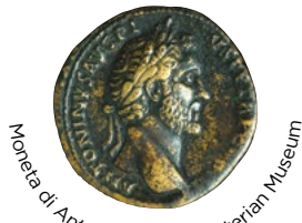
Moneta di Antonino Pio

Circa 2.000 anni fa, il Vallo Antonino costituiva il confine nord-occidentale dell'Impero Romano. Questa struttura difensiva, fatta costruire per volere dell'imperatore Antonino Pio dopo il 140 d.C., si estendeva per circa 40 miglia romane (60 km), dall'attuale Bo'ness, situata sull'estuario del fiume Forth, fino ad Old Kilpatrick, sulle rive del fiume Clyde.