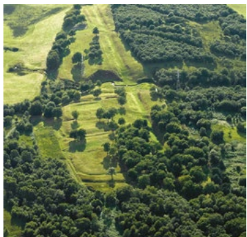
Rough Castle