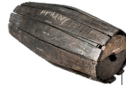
Barile proveniente da Bar Hill

Il Vallo Antonino era il confine più a nord dell'impero e, quando fu costruito, rappresentava la frontiera più complessa mai creata dall'esercito romano. Fu l'ultimo confine lineare ad essere realizzato dai Romani e venne occupato soltanto per una generazione prima di essere abbandonato intorno al 160 d.C.