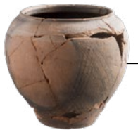
Pentola di Mumrills, Falkirk

I musei situati lungo il percorso custodiscono manufatti personali, lapidi e le cosiddette "lastre di distanza" (lastre di pietra scolpite indicanti la distanza delle varie sezioni del vallo e la legione che li aveva eseguiti); visitate il Museo di 'Auld Kirk a Kirkintilloch, Callendar House a Falkirk, il Museo Kinneil a Bo'ness, il Museo Hunterian a Glasgow, o i Musei Nazionali della Scozia di Edimburgo.