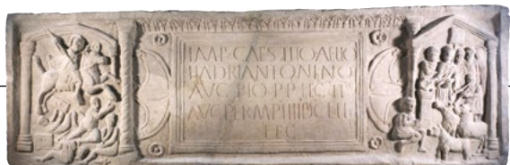
"Lastra di distanza" di Bridgeness