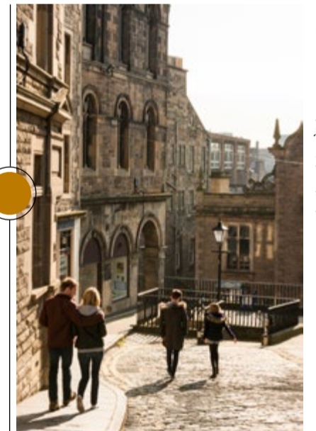
Seann Bhaile Dhùn Èideann, Upper Bow

'S e baile muilnean cotain bhon 18mh linn, air a dhèanamh suas as ùr, a th'ann an Lannraig Nuadh . Tha e suidhichte ann am mòr-ghil chumhang air Abhainn Chluaidh. Ainmeil airson cho adhartach 's a bha an dòigh-stiùiridh aig an tùsair sòisealta, Raibeart Owen, b' i a' mhuileann cotain bu mhotha a bha ann an Alba agus aon de na buidhnean gnìomhachais bu mhotha san t-saoghal.