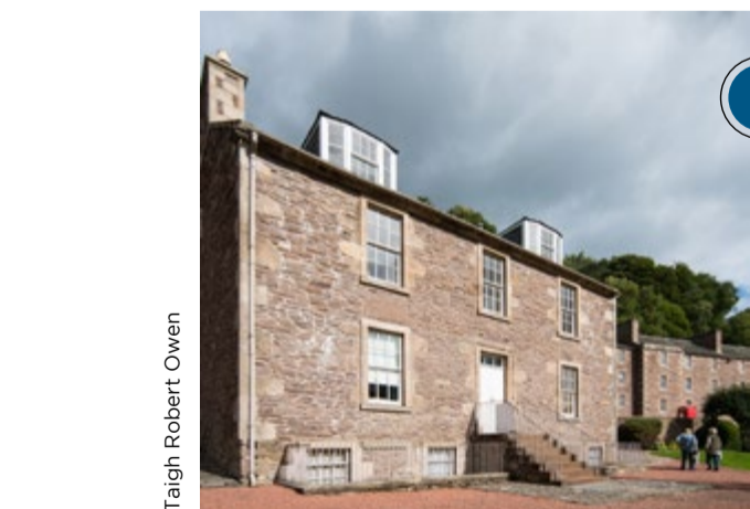
Taigh Robert Owen

Bha Balla Antonine a' comharrachadh na crìche a b'fhaide tuath a bh'aig Ìmpireachd na Ròimh bho chionn faisg air 2000 bliadhna. B'e cuideachd a' chrìoch a b' ioma-fhillte. A' ruith thairis air meadhan na h-Alba, chaidh a thogail le saighdearan Ròmanach dhan Ìmpire Antoninus Pius timcheall air AD 142. Tha an saothair air a chuimhneachadh le buidheann chlachan-mìle a tha gun choimeas.