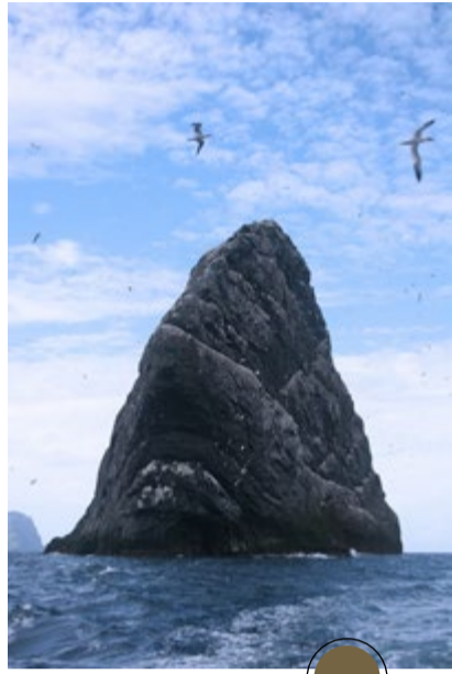
Stac Lee

'S e buidheann de dh'eileanan iomallach is stacan mara, 100 mìle bho oirthir an iar Alba, a th'ann a Hiort . Tha iad nan dachaidh don choloinidh as motha de dh' eòin-mara san Roinn Eòrpa agus do chaoraich, luchainn agus dreathain-donn nach fhaighear an àite sam bith eile. Tha cuimhneachain drùidhteach ann air mu 5000 bliadhna de dh'eachdraidh is cultur nan daoine a bha a' fuireach ann gus na dh'fhàg iad ann an 1930.