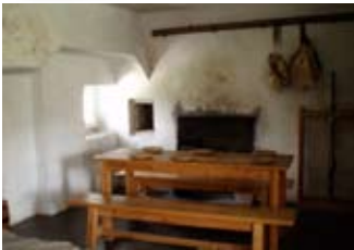
Bòrd-bìdh ann an seòmar an taigh-feachd

Buinidh a' chùlag dhiomhair san t-seòmar seo is dòcha don àm a bha an tùr aig an teaghlach Foirbeis. 'S dòcha gur ann an seo a chum stiùbhard a' chaisteil rudan luachmhor.