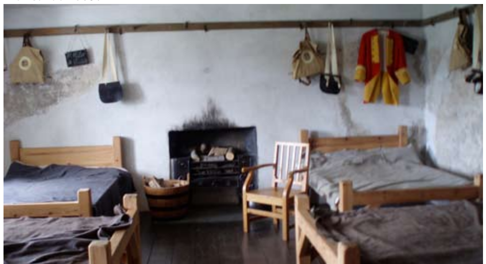
Taigh-feachd ath-chruthaichte aig Corra Garaidh