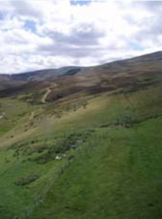
Sealladh den t-seann rathad on tùr-curraig

Cha robhar airson 's gun toireadh saighdearan an teaghlaichean leotha. Nan tigeadh iad bhiodh aca ri cadal san aon leabaidh!