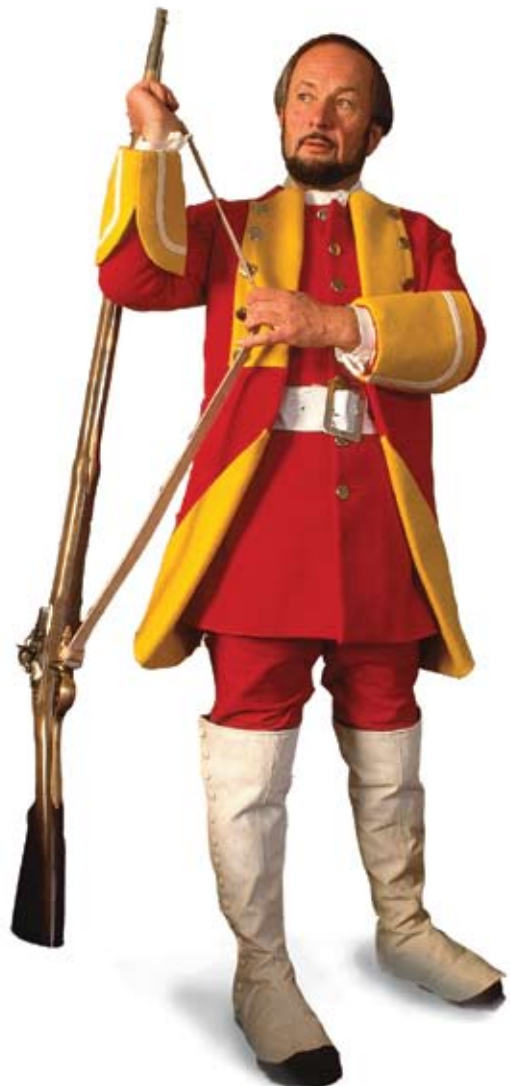
Actair sgeadaichte ann an aodach 'saighdear dearg' an riaghaltais san 18mh linn

Till sìos an staidhre don chiad làr. Nuair sin cum ort sìos staidhre chas dhorch gus na seilearan. Thoir rabhadh do sgoilearan dol air an socair. Gabh a-steach don chiad sheòmar-seileir 's cum ort don dàrna seòmar.