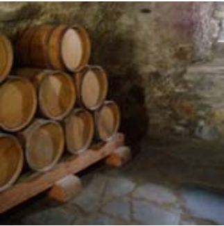
Mac-samhla de bharailllean fùdair san t-seilear

Mun deach iad dh'fhàg na Seumasaich buill-airm air an t-sitig! Ach lorg na saighdearan dearga iad - ubh!