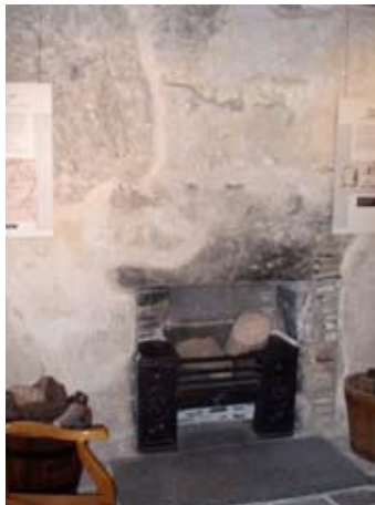
Seann chidsin le bogha teallaich aosta ri fhaicinn