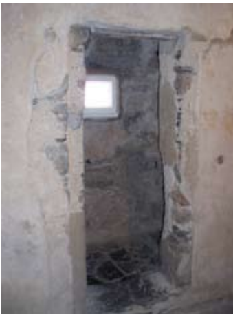
Taigh beag oifigeir

Ann an 1746 chleachd na Seumasaich an caisteal mar am prìomh ionad aca. Thug saighdearan dearga Bhreatainn ionnsaigh air ach mun àm a ràinig iad bha na Seumasaich air teicheadh. Bha teine fòs a' dol san t-seòmair seo le cat na chadail ri thaobh!