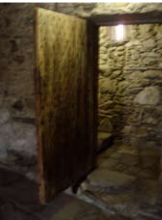
Doras an t-Seileir