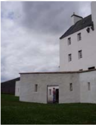
Pàirt den bhalla a-muigh

Àrd os cionn an dorais tha na th' air fhàgail de dh'ùrlar beag cloiche. Sna seann làithean dh'fhaodadh tu a bhith fo ionnsaigh bho shuas nan dèanadh tu oidhirp briseadh a-steach tron doras!