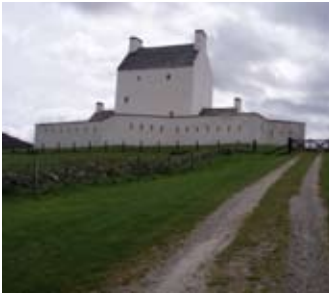
A' tighinn dlùth ri Corr Garaidh