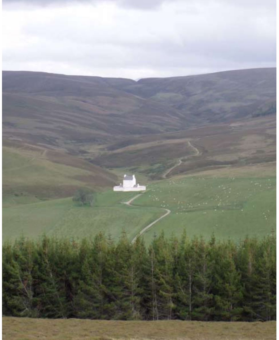
Corr Garaidh on Tuath

mu làr agus b' e dithis pheathraichean Ros an fheadhainn deireannach a dh' fhan air mhàl ann gu 1912. Mu dheireadh chuireadh e fo chùram na stàite an 1961. An-diugh tha an caisteal ath-nuadhaichte agus faodaidh luchd-tadhail coimhead air seòmraichean an taigh-feachd mar a bha iad sna 1750an.