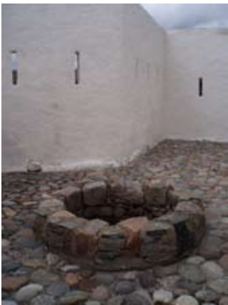
Tobar Corr Garaidh taobh a-staigh den lios