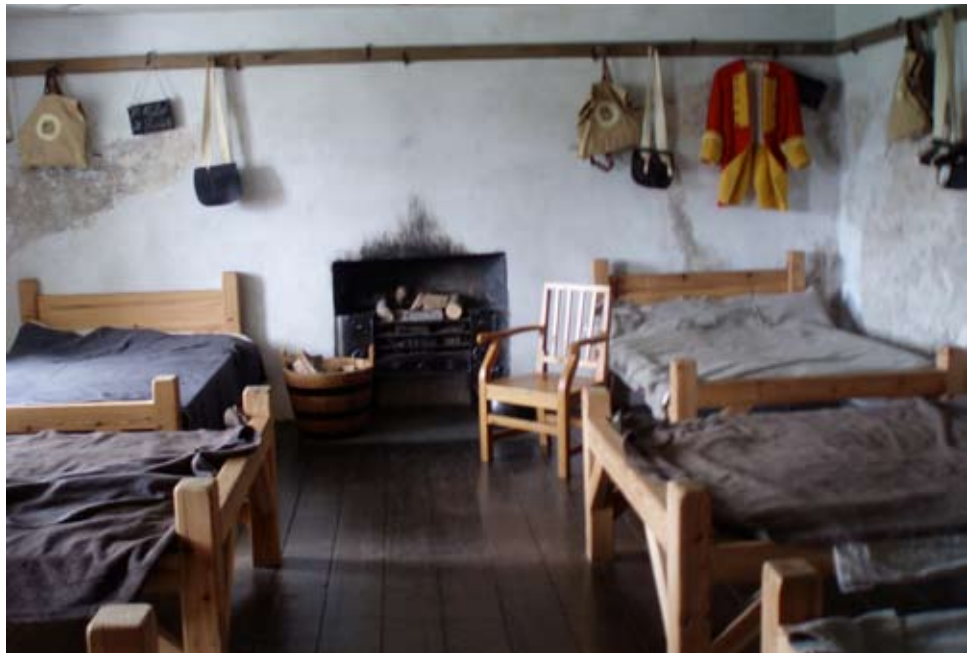
Seòmair an taigh-feachd

Smaoinich gur saighdear dearg thu. Bha thu a-muigh fad an latha a' cumail faire air cnoc 's air baile. Tha thu nis air ais san taigh-feachd. Tha cuid agaibh a' còcaireachd, càch ag ithe, cuid a' brodadh an teine. Tha cuid a' càradh an cuid aodach is uidheamachd. 'S dòcha gun robh là làn thachartasan aig cuid agaibh - cha d' rinn càch mòran. A bheil thu ag ionndrainn do theaghlach an seo?