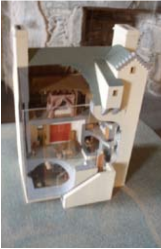
Modail de Chorr Garaidh san 16mh linn

Cum ort suas an staidhre don ath-làr. Tha seo an ìre mhath falamh a-nis ach 's e seòmar taigh-feachd a bhiodh ann, coltach ris an fhear a tha shìos. Tha modail an seo a sheallas coltas a' chaisteil nuair a chaidh a thogail an toiseach.