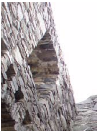
A' sealltainn suas chun nan teallaichean