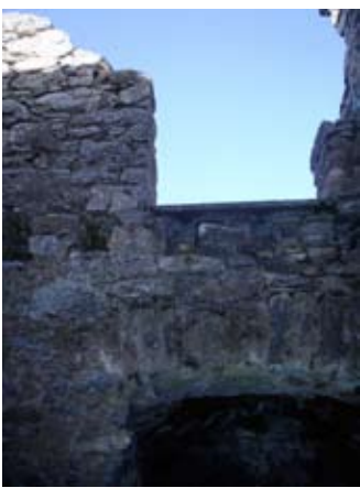
Slighe-steach gu seòmraichean nan oifigearan