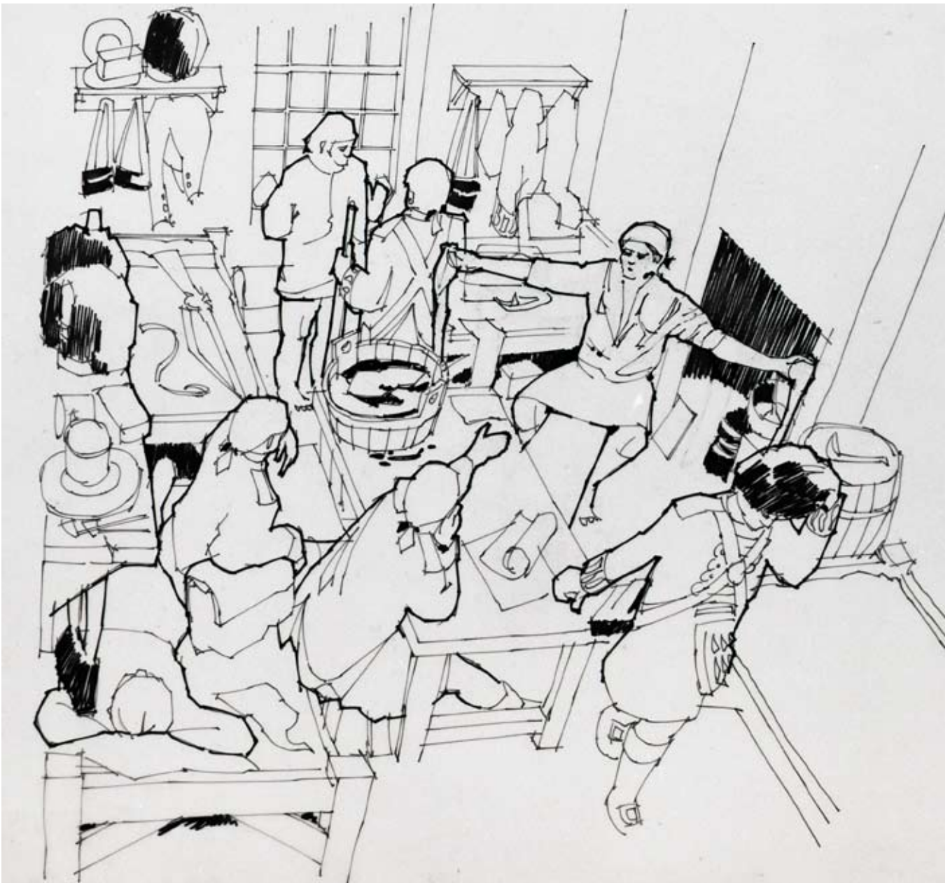
Seòmair an taigh-feachd 's e trang

Fàg am bloc seo. Gabh tarsainn na faiche is a-null a dhèanamh rannsachaidh air àrainn an tùir bhig dìreach air taobh deas a' bhloc eile.