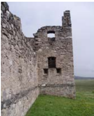
Tùr is taigh nan geàrdan on taobh a-muigh