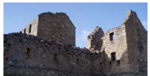
An t-slighe-steach is taigh nan geàrdan

Rud iongantach is dòcha, a thaobh a shuidheachaidh cudromaich, cha deach Ruadhainn ath-thogail a-riamh an dèidh Bliadhna Theàrlach. 'S e an tobht a chì sinn an-diugh a bheag no mhòr na tha air fhàgail an dèidh sìoladh an teine a chuir na Seumasaich ris an 1746.