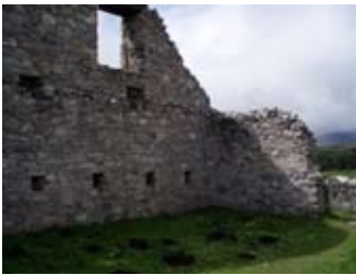
A-staigh san stàball