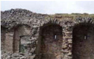
Geata le lùban cuilbheir air dheas