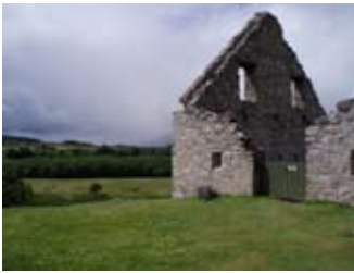
Ceann an iar den stàball

Theirear 'dragon' ri saighdear air muin eich!