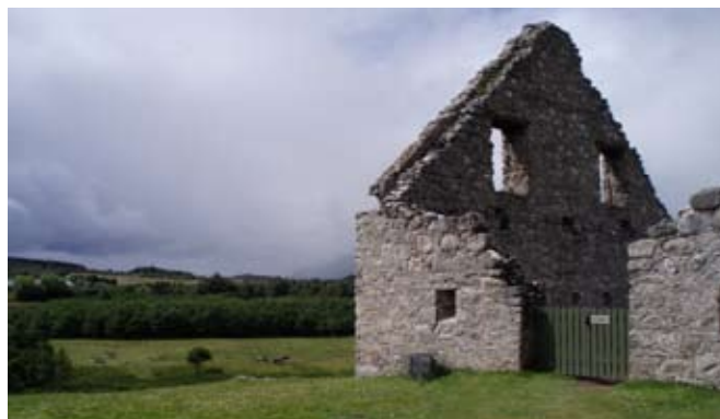
Oisean den stàball

Air làrach-lìn Alba Aosmhor gheibh luchd-teagaisg goireasan a bharrachd mar thaic air obair air làraich. Nam measg seo tha a bhith a' cur ri chèile Clàr Fianaise . Faic www.historic-scotland.gov.uk .