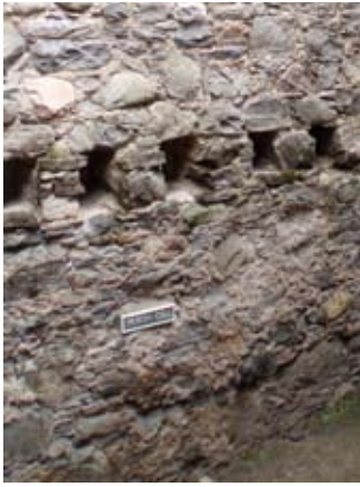
Cealla prìosain agus taigh nan geàrdan

Bha smachd glè chruaidh san arm. Dh'fhaodadh saighdear a bhith air a chur fo ghlais 's e air rud ceàrr a dhèanamh, no chuireadh tuilleadh dleistanais air. Ann am fìor droch shuidheachadh, rachadh saighdear a chuireadh le slat sgiùrsaidh ' cat o'nine tails '.