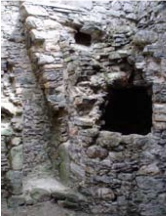
Àmhainn san taigh-fuine