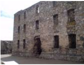
Slighe-steach don taigh-feachd a deas

Bha aig na saighdearan ri leapannan a roinn! 'S dòcha gur e deagh dhòigh a bh' ann air cumail blàth. Ach fhuair na h-oifigearan leabaidh an urra!