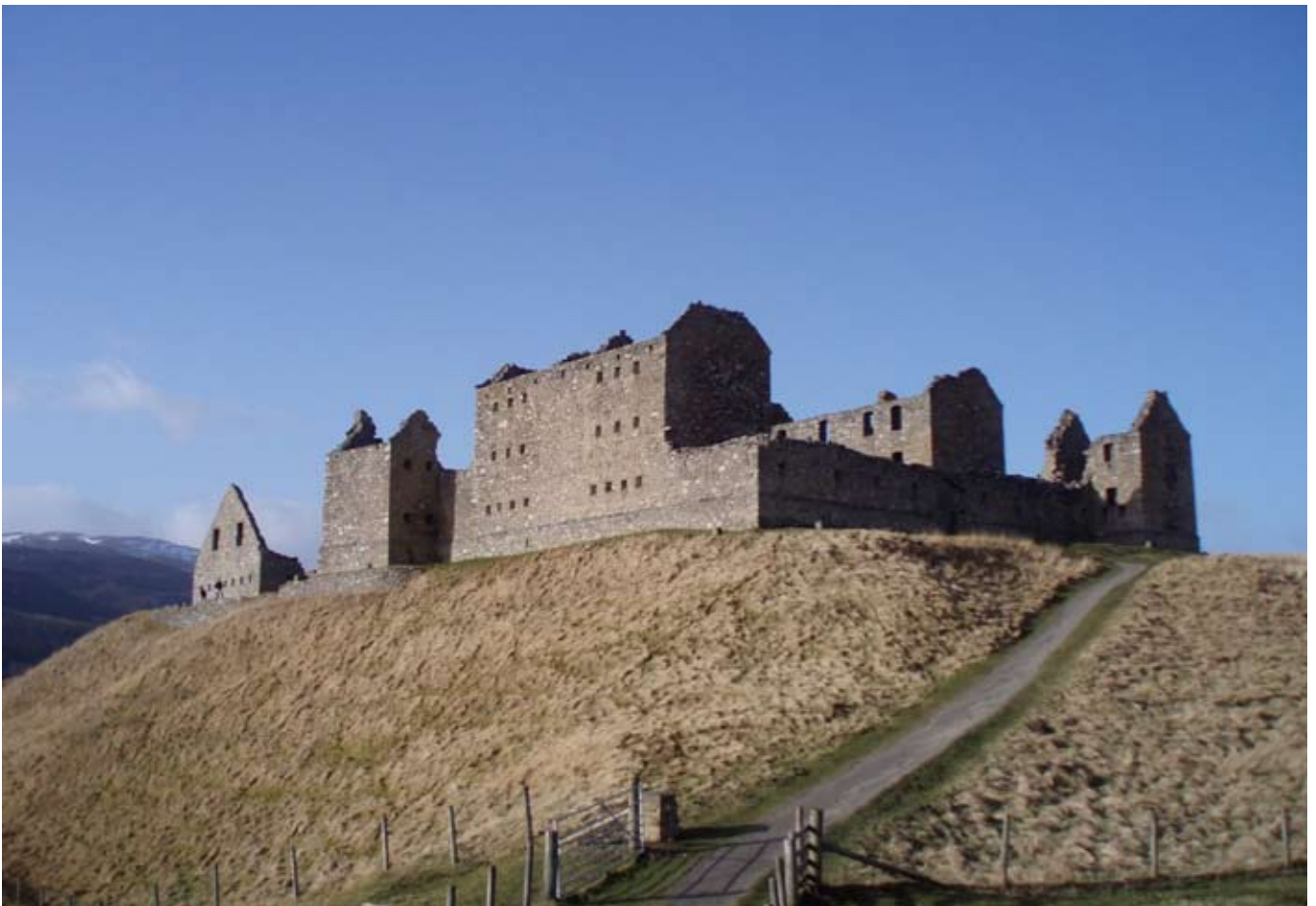
Taigh-Feachd Ruadhainn an-diugh

Gabh suas an tom is tron gheata gus an seas thu am meadhan na liosa. Sir pannal-fiosrachaidh a sheallas dealbh de choltas an taigh-feachd mar a bha e.