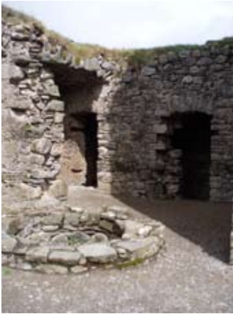
Tobar is taighean beaga (latrines)