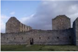
An doras air an tug na Seumasaich ionnsaigh