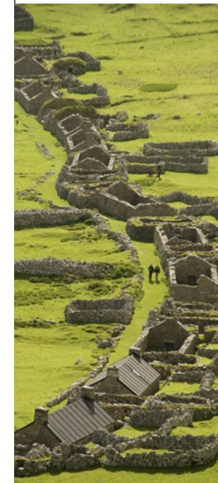
La calle, Hirta