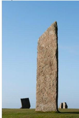
Las piedras enhiestas de Stenness

Fue inscrito en la Lista del Patrimonio Mundial en 2008, pasando a formar parte de la frontera del Imperio Romano junto con la Muralla de Adriano y el Limes Germanicus [frontera germana].