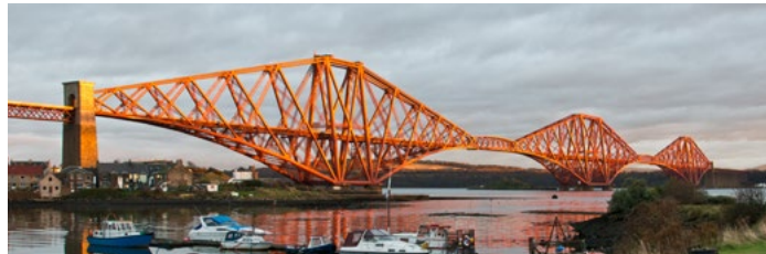
El puente sobre el río Forth desde North Queensferry

Cada uno de estos sitios por separado es una obra maestra de diseño y construcción lítica y, en conjunto, constituyen uno de los paisajes neolíticos más ricos de Europa occidental que ha perdurado hasta nuestros días.