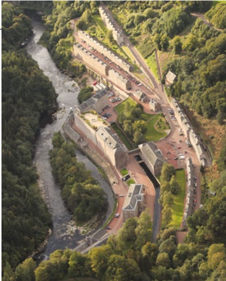
New Lanark

Weitere Informationen über die Umgebung und die Naturgeschichte des Clyde Valleys finden Sie auf den Websites des Scottish Wildlife Trust und Community Action Lanarkshire, die auf der Rückseite dieses Informationsblatts aufgeführt sind.