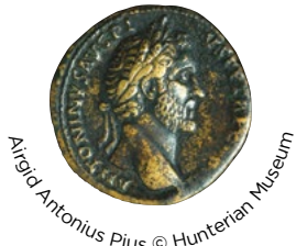
Argent Antonius Pius

Bho chionn faisg air 2000 bliadhna, b'è Balla Antonine a' chrìoch a bha air Ìmpireachd na Ròimhe san iar-thuath. Air a thogail le òrdugh Ìmpire Antoninus Pius anns na bliadhnaichean an dèidh AD140, bha e a' sìneadh fad 40 mìle Ròmanach (60 cm) bho far a bheil Ceann Fhàil an latha an-diugh air linne Foirthe gu Seann Cille Phàdraig air Abhainn Chluaidh.