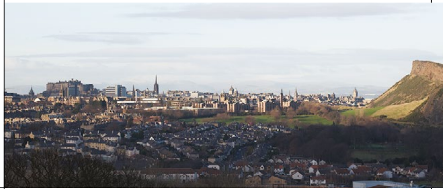
Panorama da Holyrood Park

Edimburgo è la capitale della Scozia da oltre 500 anni, divenuta particolarmente nota per i suoi scrittori, artisti, filosofi e scienziati. Fu la patria dell'economista Adam Smith, del filosofo David Hume e dei romanzieri Sir Walter Scott e Robert Louis Stevenson.