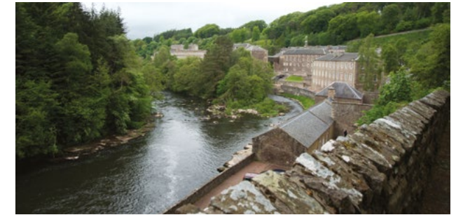
New Lanark et la rivière Clyde

L'UNESCO a inscrit New Lanark sur la Liste des Sites du patrimoine mondial en 2001, en reconnaissance de son rôle dans l développement de communautés industrielles modèles.