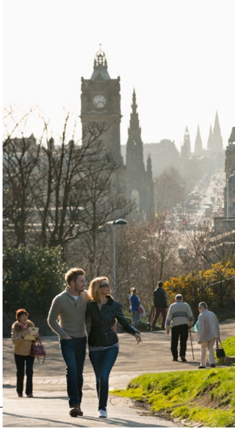
Princes Street depuis Calton Hill