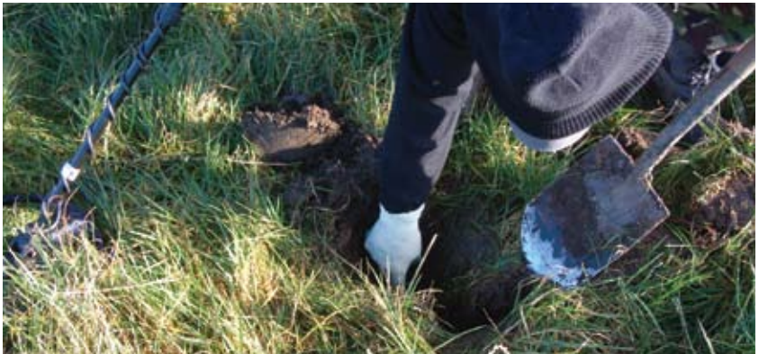
Feumaidh tu cead sgrìobhte ro làimh bho Mhinistearan Albannach airson sgrùdadh meatailt a dhèanamh air làrach clàraichte.

Mar sin tha e gu sònraichte cudromach dèanamh cinnteach gu bheil a h-uile duine a tha ag obair air an fhearann agad (nam measg cùnnradair, nach bidh cho eòlach air comharran ionadail) mothachail air làthaireachd, meud fearainn agus luach charraighean clàraichte. Ma tha thu a' ceadachadh obair a nì cron air carragh clàraichte, faodaidh tu a bhith buailteach gu laghail.