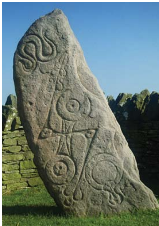
Eisimpleir de leac shamhlachail Chruinneach bhò sgìre Aonghais.

Ma tha thu a’ ceannach, bu chòir dhan neach-lagh agad faighinn a-mach mu dheidhinn làthaireachd carragh clàraichte tro Chlàr nan Sasines no Clàr an Fhearainn. Tha am fiosrachadh cuideachd ri fhaighinn saor san asgaidh air an eadar-lìon tro PASTMAP < www.pastmap.org.uk >.