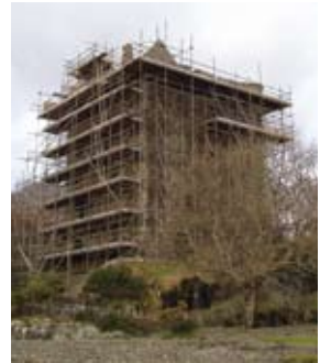
Faodaidh taic a bhith ri fhaotainn airson obair a tha gu buannachd staid na làraich no a chuireas ri cuid maireannachd san fhad-ùine.

Ma tha trioblaidean sònraichte ann, neo nach urrainn dhan neach-faire ceistean mionaideach a fhreagairt, cuiridh an neach-faire air dòigh gun tadhail neach-sgrùdaidh sgìre bho Alba Aosmhor. Faodaidh sealbhadairean agus luchd-còmhnaidh fios a chur thugainn airson comhairle uair sam bith.