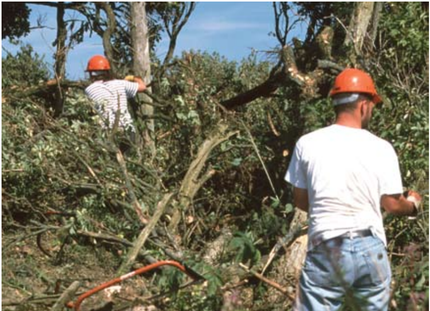
Saor-thoilich a cuideachadh gus glasaich chummartach a ghlanadh bho dhùn ro-eachdraidheil.

Tha barrachd fiosrachaidh mun phròiseas seo ann am Poileasaidh Àrainneachd Alba Aosmhor.