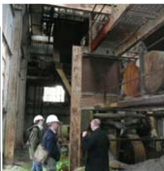
Tha Alba Aosmhor a' tairginn fiosrachadh, comhairle mion-eolach agus taic.

Tha clàradh a' dìon na h-eisimpleirean as cudromaiche dhe na carraighean seo, a tha gu math tric breòite agus ann an cunnart, airson maith na dùthcha. Tha Alba Aosmhor, buidheann-ghnìomha de Riaghaltas na h-Alba, a' moladh gum bu chòir carraighean a chlàradh, gu gnìomhail a' brosnachadh stiùireadh adhartach charrighean clàraichte agus a' cumail smachd air obair riutha tron dòigh-obrach cead laghail.