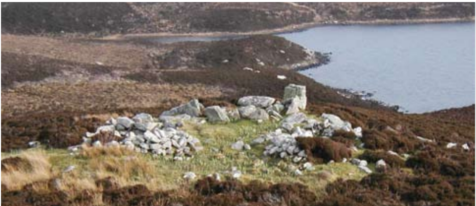
Chan fheum carraighean a bhith sgeadaichte no maiseach airson a bhith cudromach.

Tha Alba Aosmhor a' dèanamh measadh air carraighean mu choinneamh stiùireadh agus slatan-tomhais a tha air an cur a-mach leis na Ministearan Albannach. Tha seo a' gabhail suim de roghainn farsaing de bhuidheannan, nam measg ealanach, àirseachail, ailtireil, eachdraidheil, traidiseanta, mothachail, saidheansail agus sòisealta.