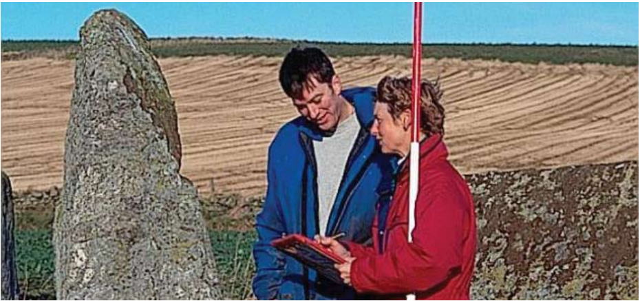
Tha Alba Aosmhor a' brosnachadh còmhraidhean tràth mu dheidhinn obraichean sam bith a tha san amharc.

Tha thu a' cur a-staigh airson CCC le bhith a' lìonadh foirm a tha ag iarraidh fiosrachadh mun charragh, an sealbhadair ('s dòcha nach e am fear a tha ag iarraidh cead) agus na h-obraichean a tha san amharc. Tha am foirm ri fhaighinn air làrach-lìn Alba Aosmhor no bho Luchd-sgrùdaidh Alba Aosmhor. Bu chòir dhut fiosrachadh gu leòr a thoirt seachad a bheir tuigse mun obair a tha san amharc agus a' bhuidhe a bhios aca air a' charragh, le map a' sealltainn làrach nan obraichean. Tha e nas fheàrr bruidhinn mu dheidhinn na molaidhean agad ris an neach-sgrùdaidh sgìre mus cuir thu tagradh a-steach airson cead. Chan eil Alba Aosmhor ag iarraidh pàigheadh sam bith airson tagraidhean no comhairle.