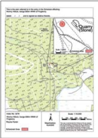
Tha sealbhadairean agus luchd-còmhnaidh cuideachd a' faighinn mapaichean a' sealltainn meud nan sgìrean clàraichte. Àir. Ceadachd Alba Aosmhor 100017509 [2008].

Cuiridh sinn air dòigh tadhal air an làrach agus mìneachadh dè a th' ann an clàradh agus dè na builean a bhios aige. Goirid às dèidh dhuinn tadhal, sgrìobhaidh sinn a ràdh a' bheil no nach eil sinn am beachd an làrach a mholadh airson clàradh agus, ma tha, cuiridh sinn làn fhiosrachaidh mun mholadh chun an t-sealbhadair agus neach-còmhnaidh.