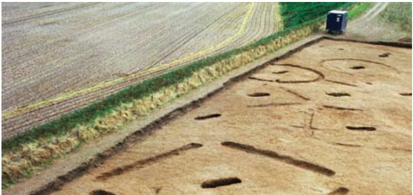
Faodaidh fianais àirseachail maireachdain dìreach fon talamh treabhaidh agus tha e mar sin ann an cumart a rèir atharrachaidhean ann an cleachdadh fearainn.

Ach, chan eil a h-uile gnìomh àiteachais air a chòmhdach gu nàdarra le ceadan clas. Tha e cudromach mothachadh gum feum atharrachaidhean leithid treabhadh nas duimhne, obair fon sgrath agus obraichean drèanaidh CCC, ach chan fheum atharrachadh bho treabhadh gu ìonaltradh.