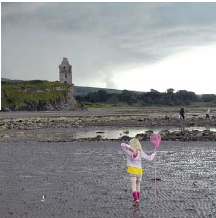
Tha carraighean àirseachail a' tairginn ceangal susbainteach, fìsiceach ris an àm a chaidh seachad.