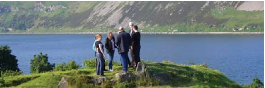
Chan eil clàradh ag atharrachadh an roghainn farsaing de sholarachaidhean airson cothrom a thoirt dhan phoball faighinn air fearann ann an Còda Ruigsinneachd Alba A-muigh (faic < www.outdooraccess-scotland.com >).

Chan eil clàradh a' toirt inbhe shònraichte sam bith do dh'arceòlaichean a thaobh a bhith a' faighinn thuige, no a bhith ag obair air talamh prìobhaideach. Gu dearbh, 's ann a tha clàradh a' dì-mhisneachadh cladhach àirseachail. Feumaidh arceòlaichean a tha ag iarraidh cladhach air làrach chlàraichte cead bhon uachdaran agus an neach-còmhnaidh, a thuilleadh air CCC, a dh'fhaodas gearain a thogail bhon uachdaran agus luchd-còmhnaidh.