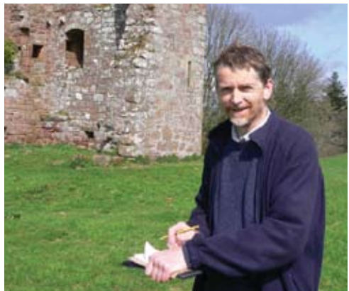
Tha Alba Aosmhor a' cur air dòigh airson tadhal air làraichean agus measadh a dhèanamh air a' bhrìgh aca.

Mar as trice tha carragh air a chlàradh gu bràth. Ach, 's dòcha gum feum sgìrean clàraichte atharrachadh mar a tha sinn a' togail barrachd eòlais.