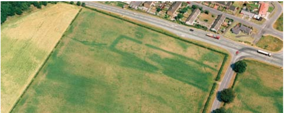
Faodaidh treabhadh fad-ùine a bhith air comharran uachdrach làraichean a thoirt air falbh. Ach, faodaidh cuid de shuidheachaidhean, leithid tart, ciallachadh gum faicear làraichean bhon adhair an luib bàrr a tha a' fàs (comharran-bàrr mar a theirear riutha).