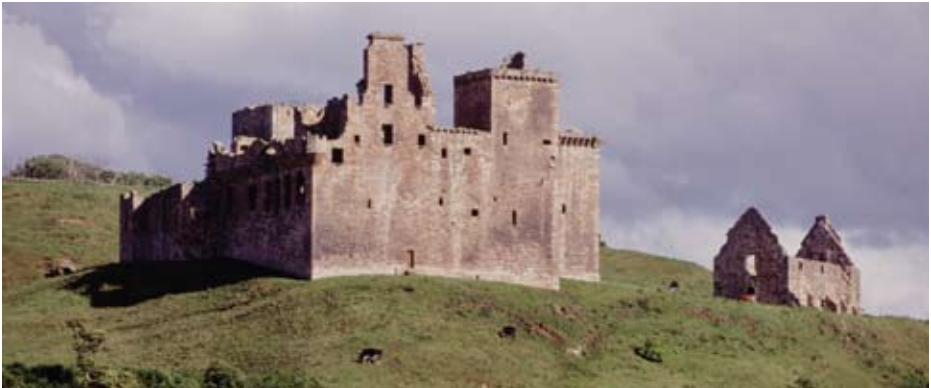
Crichton, caisteal clàraichte ann am Meadhan Lodainn.

Chan e an aon rud a tha ann an clàradh carraighean ri clàradh toglaichean. Tha Alba Aosmhor a' clàradh toglaichean bho pròiseas liostadh, a tha air a dhealbh airson togalaichean agus structaran eachdraidheil a dhìon agus a tha mar phàirt de dhòigh-obrach lagh tur eadar-dhealaichte. Ach, tha na dhà a' tairginn bunait airson dèanamh cinnteach gu bheil stiùireadh atharrachadh air a dheagh fhiosrachadh.