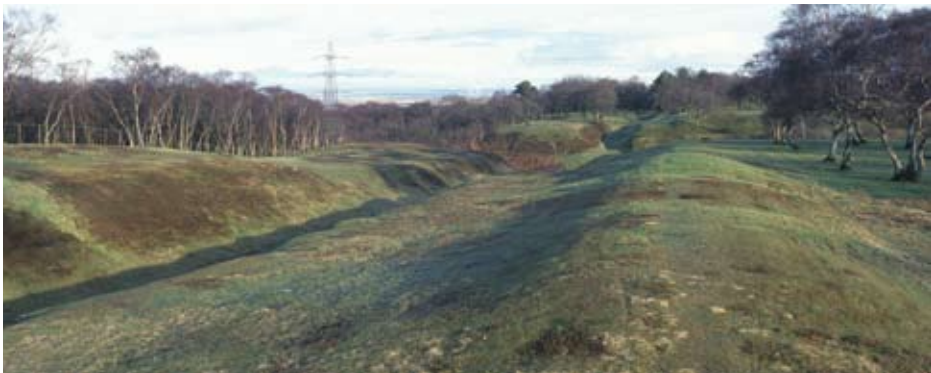
Ann an cuid a chùisean tha an sgìre sa bheil ùidh agus cudromachd, agus mar sin an sgìre chlàraichte, a sìneadh seachad – uaireannan gu math fada seachad – air na tha gu follaiseach air fhàgail

Tha barrachd fiosrachaidh mu bhith a' dìon charraighean cudromach nàiseanta na h-Alba ri fhaighinn ann am Poileasaidh Arainneachd Alba Aosmhor.