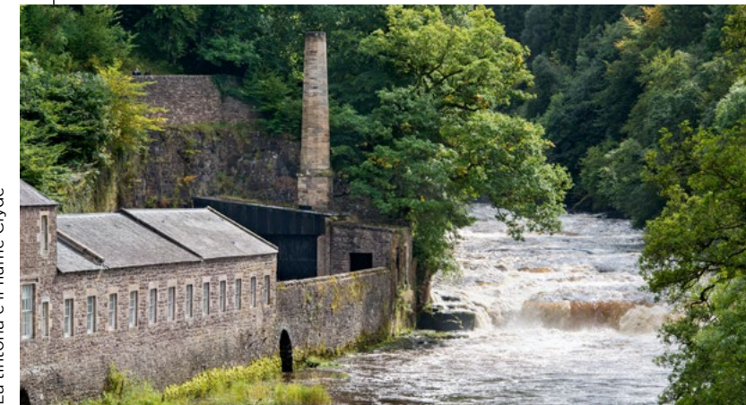
La tintoria e il fiume Clyde

Già nel 1799, New Lanark ospitava il più grande cotonificio della Scozia uno dei più grandi stabilimenti industriali del mondo. Oltre 2.000 persone vivevano o lavoravano nel villaggio. Il cotonificio continuò la produzione di tessuti in cotone per quasi 200 anni, fino al 1968. Questo spiega il motivo per cui le costruzioni del villaggio non siano molto cambiate.