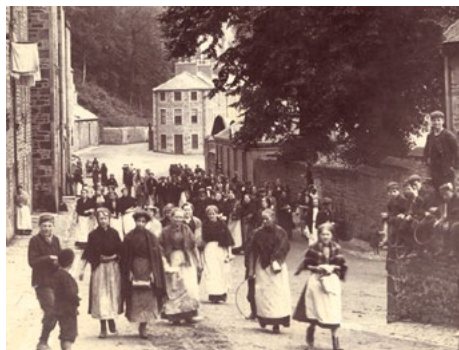
Operai del cotonificio