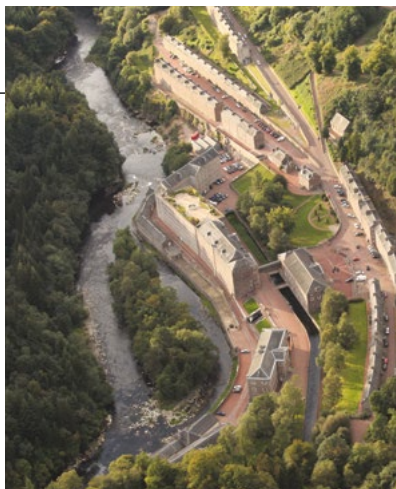
New Lanark

Per approfondimenti sull'intera regione e sulla storia naturale della valle del Clyde, consultate il retro del presente opuscolo dove troverete i contatti dello Scottish Wildlife Trust (Fondo per la conservazione della flora e della fauna in Scozia) e dalla Community Action Lanarkshire.