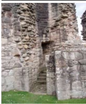
Staidhre san tùr eadarra