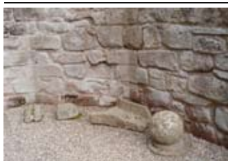
Ball-cloiche san tùr eadarra