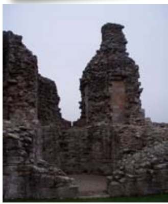
An tùr eadarra

Ri linn Raibeart Bhrus cha robh gunnaichean ann. Shabaid daoine le claidheamh, tuagh, bogha 's saighead. Thug iad ionnsaigh air caistealan coltach ri seo le clach-bhogha mhòr mhòr air a bheil trebuchet, no le reithe-cogaidh air na ballachan.