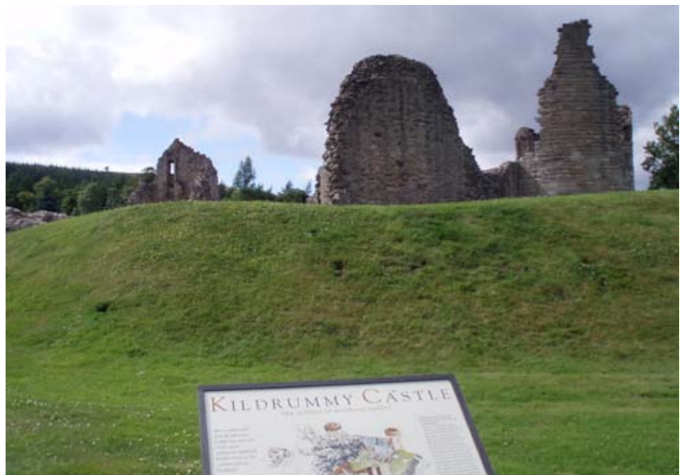
Taobh a-muigh a' chaisteil le pannal-fiosrachaidh