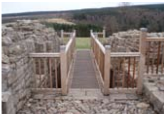
Drochaid an latha an-diugh aig slighe-steach a' chaisteil