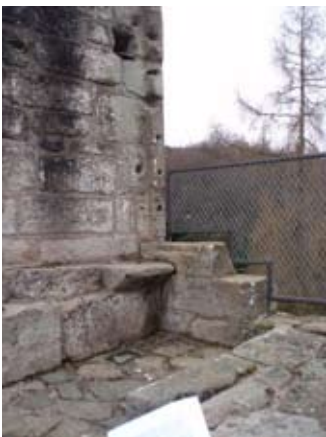
Uinneag le suidheachan