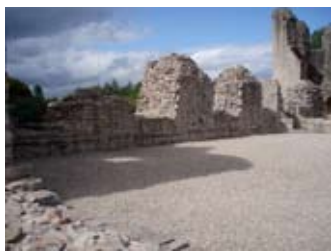
An talla mòr

Thàinig crìoch iomchaidh air a' ghobha chealgaireach. Fhuair e duais an òir o na Sasannaich airson teine a chur ris a' chaisteal - ach b' e òr leaghte e, a chaidh a dhòirteadh sìos a shlugan is a mharbh e.