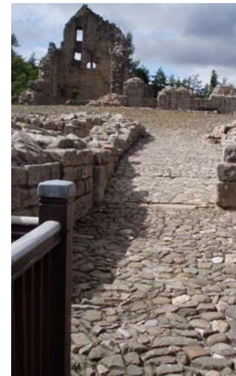
A' dol a-steach do Chinn Droma