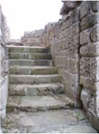
Geata-cùil a' chaisteil (postern gate) le eagan an eirc-chòmhlà

Sna seann làithean cha robh uisge na h-aibhne sàbhailte ri òl mura goileadh e. Mar sin dh'òl a h-uile duine lionn - fiù na pàistean!!