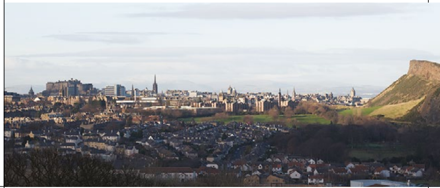
Skyline vom Holyrood Park

Edinburg ist seit 500 Jahren die Hauptstadt Schottlands und besonders für seine Schriftsteller, Künstler, Philosophen und Wissenschaftler berühmt. Hier haben der Ökonom Adam Smith, der Philosoph David Hume und die Schriftsteller Sir Walter Scott und Robert Louis Stevenson gelebt.