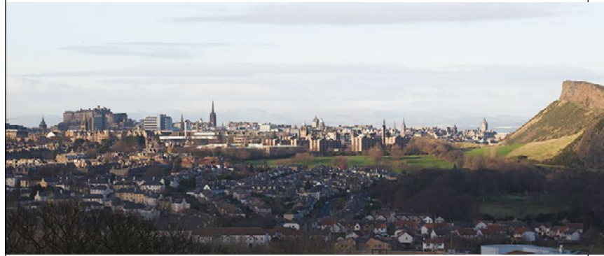
Skyline bho Phàirc Holyrood

B' e Dùn Èideann prìomh bhaile na h-Alba fad còrr air 500 bliadhna, agus dh'fhàs e dha-rìribh ainmeil airson a sgrìobhaichean, luchd-ealain, luchd-saidheans agus fheallsanaichean. B' e dachaigh an eaconamair Adam Smith, am feallsanaiche David Hume agus na h-ùghdairean Sir Walter Scott agus Robert Louis Stevenson.