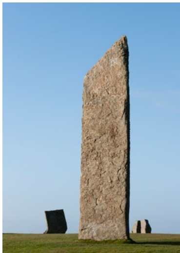
De gauche à droite Les Pierres de Stenness Maeshowe Intérieur de Maeshowe Le Cercle de Brodgar

Chacun de ces sites est un chef-d'oeuvre de conception et de construction néolithiques en pierre. Ensemble, ils représentent l'un des plus riches paysages néolithiques subsistant en Europe occidentale et nous donnent un aperçu exceptionnel de la société, des compétences et des croyances spirituelles du peuple qui les a construits.