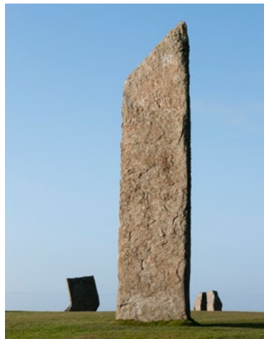
Von links nach rechts Die Stones of Stenness Maeshowe Maeshowe Inneneinrichtung Der Ring of Brodgar

Diese Monumente, jedes für sich genommen ein Meisterwerk des frühen Mauerwerkbaus, bilden zusammen eine der am besten erhaltenen Landschaften der Jungsteinzeit in Westeuropa. Sie erlauben uns einzigartige Einblicke in die Gesellschaft, Fertigkeiten und religiösen Vorstellungen der Menschen, welche sie erbaut haben.